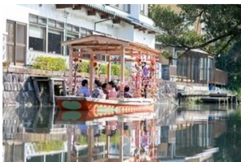
図.「お堀めぐり」の例

※解散後、福岡空港や博多駅までの送迎あり。 引き続き柳川観光をされる方は、各自でお帰りください。