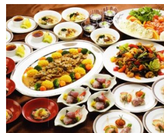
図. 懇親会の御料理（予定）